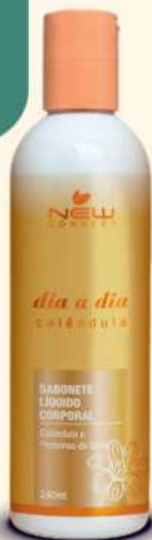
DIA A DIA Sabonete Líquido Corporal - 240ml

Hidrata, devolve a umidade da pele e restaura seu brilho natural.