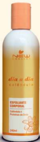
DIA A DIA Esfoliante Corporal - 240ml