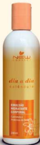
DIA A DIA Emulsão hidratante - 240ml

Elimina as células mortas sem ressecar a pele, devido as suas propriedades hidratantes. Média abrasividade.