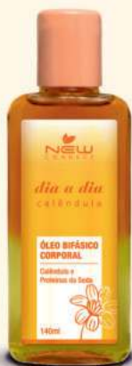
DIA A DIA Óleo Bifásico Corporal - 140ml

Limpa deixando sua pele profundamente perfumada e hidratada.